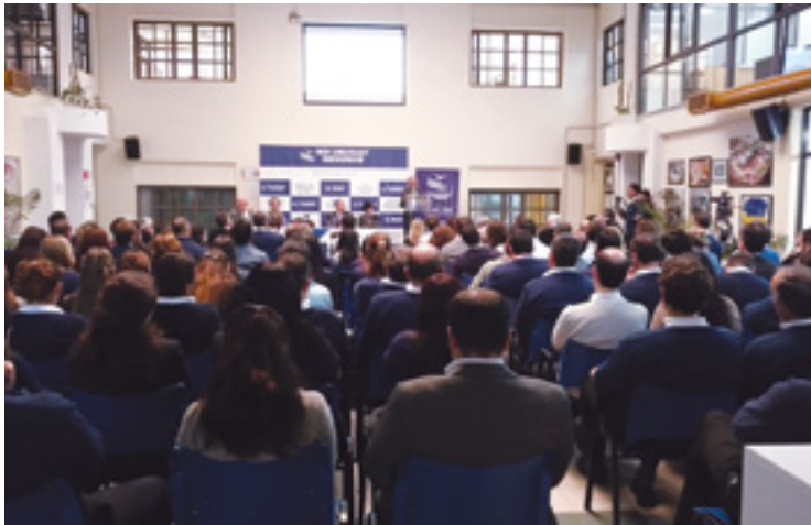
ESTA UNIVERSIDAD BUSCA QUE RUS "SEA VANGUARDIA EN EL MERCADO DE SEGUROS".

Consta de cuatro escuelas que apuntan a anticiparse a los nuevos desafíos que plantea el mercado. Y a favorecer la ampliación de conocimientos y aprendizajes tanto desde el aspecto individual (de los empleados y ejecutivos de RUS) como desde el organizacional.